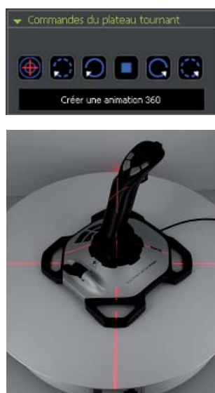
Рычаг управления подиумом и лазерным центрированием.