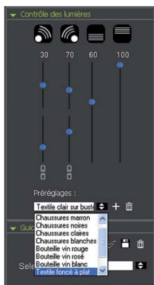
Панель управления подсветкой с библиотекой предварительных настроек.

К программе Easy – ScanCube в зависимости от прогресса технологий и потребностей наших клиентов регулярно добавляются новые функции. Мы предлагаем вам мини-фото студии с последующим бесплатным обновлением программы в течение года.